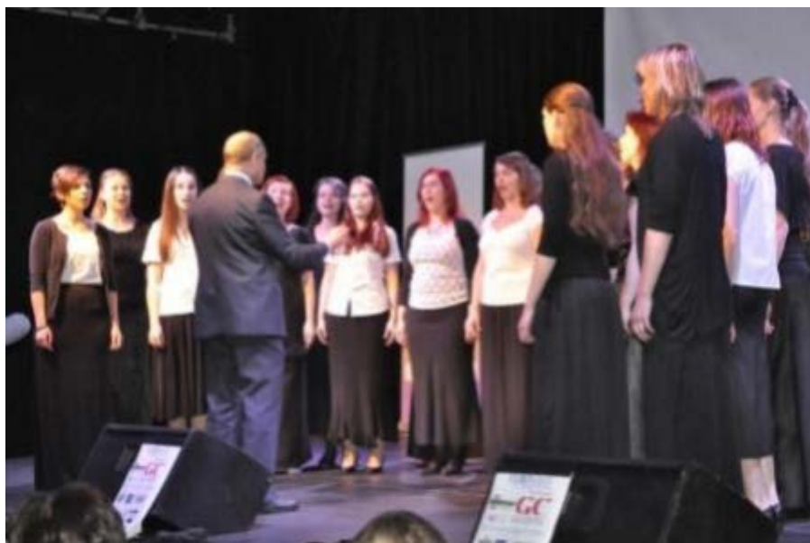
Židovské a chasidské písně